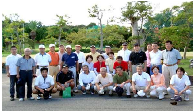
第64回 北輪会ゴルフコンペ参加者