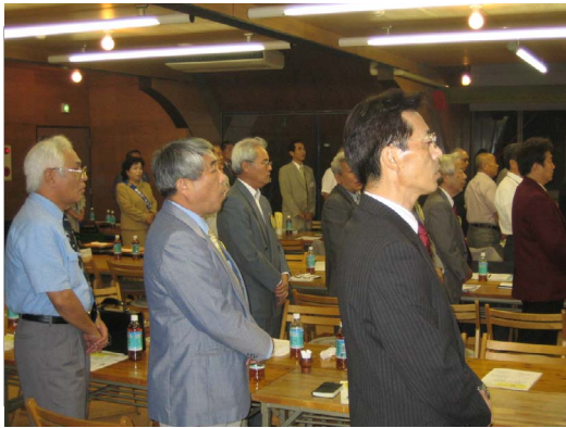
“君が代” “奉仕の理想” を唱う