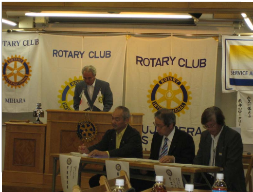
井関出席委員長より出席報告