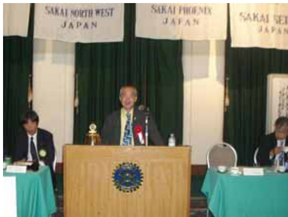
「ガバナーアドレス」内容については 会報通巻391号 本年度no.1参照