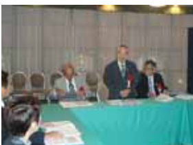
平尾ガバナー挨拶