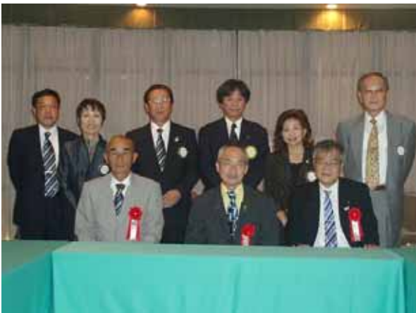
懇談に先立って記念撮影