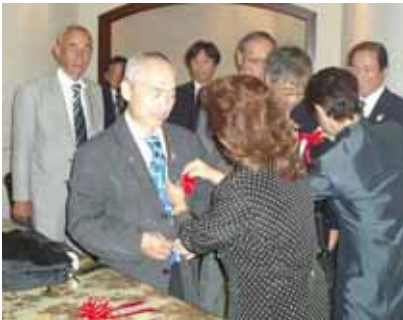
会長幹事懇談会場(2F リセス)前にて