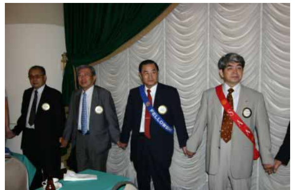
合同例会 手に手つないで