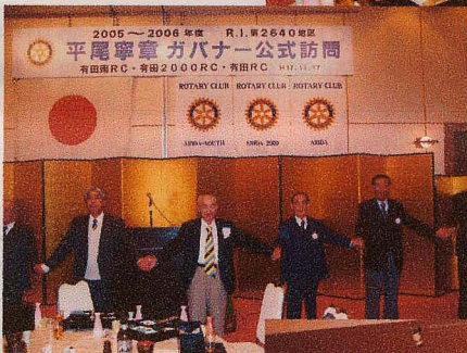
♪ 手に手 つないで〜