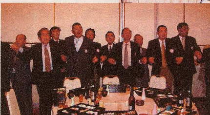
皆さん、お疲れさまでした。