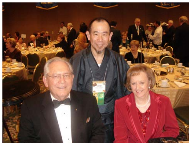
前R I会長：グレン・エステス夫妻と