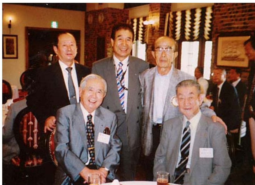
和歌山西RC公式訪問にて先輩の皆様と