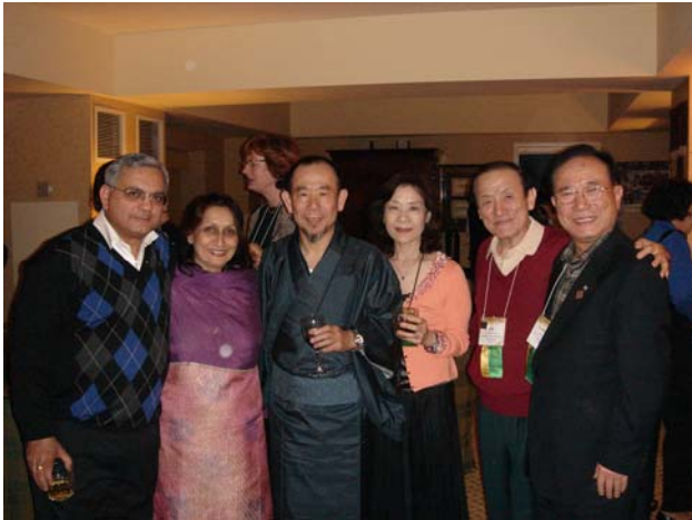
インド、韓国のリーダーと