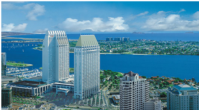
マンチェスターグランド・ハイアット・サンディエゴホテル