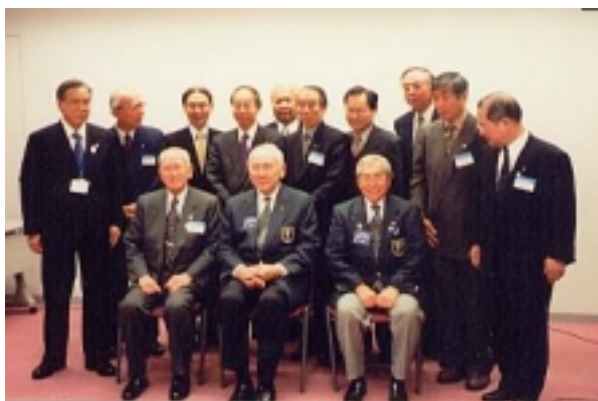
11/29 ゾーン会員増強委員長会議 (ラタクルR I会長を囲んで)

本年度はガバナー補佐の皆様方に、それぞれ受け持ちの各クラブをご訪問頂き、そのクラブ