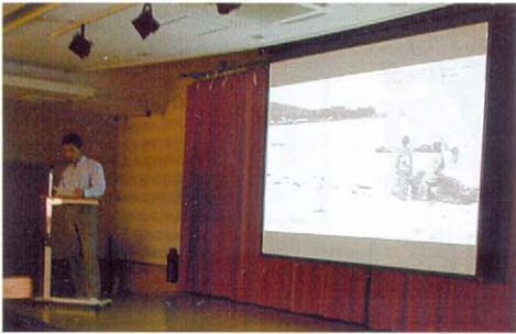
BGMにのり大正時代の白良浜の風景から始まる