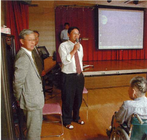
感謝の言葉を述べられる柏木園長さん