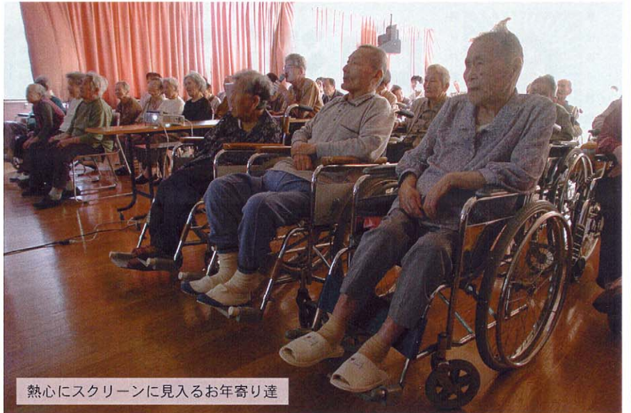
熱心にスクリーンに見入るお年寄り達