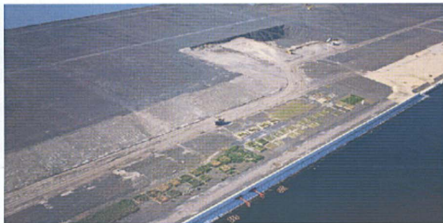
8月30日現在 陸化 480ha (完成 545ha)