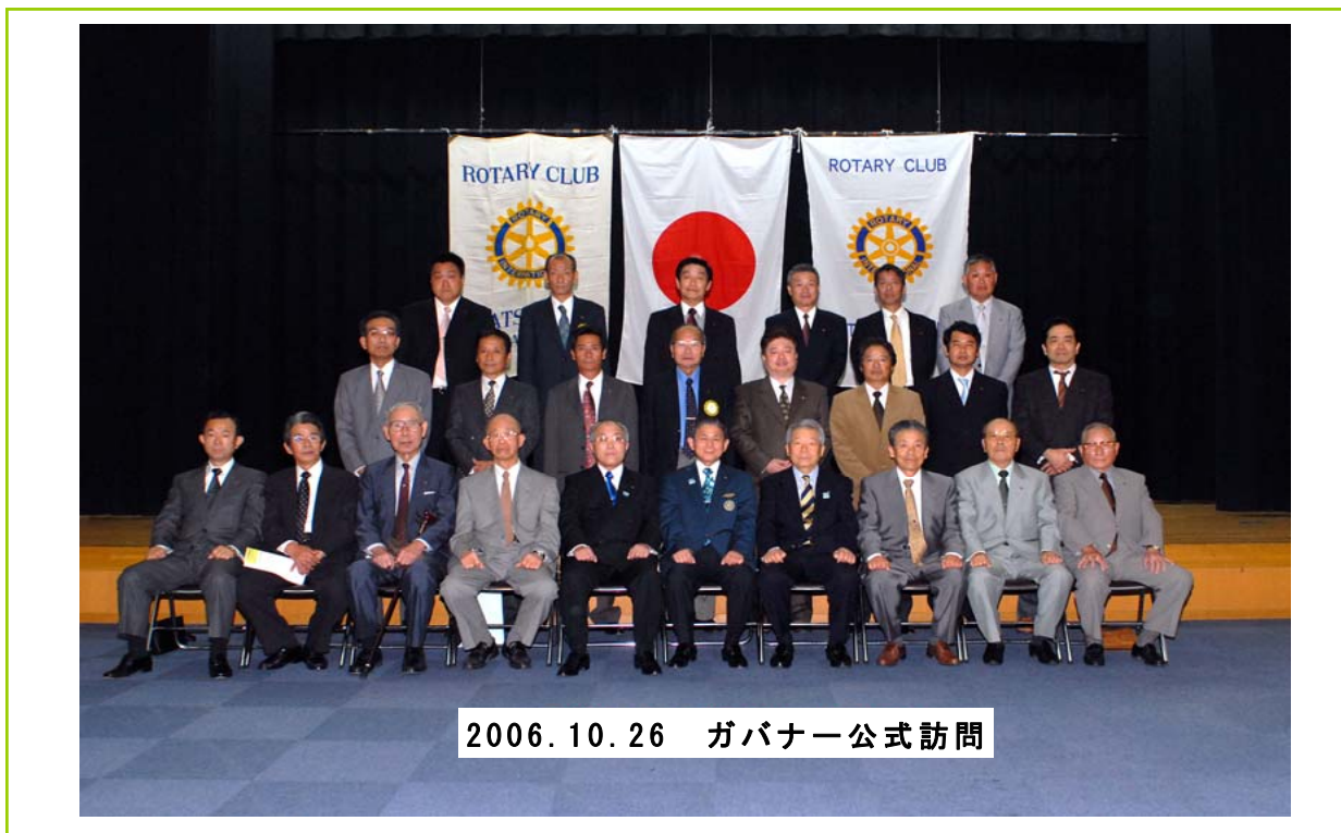
2006. 10. 26 ガバナー公式訪問

見直していただいて、自由に変えてください。今までも細則を変えてもよかったのですが、ほとんどありませんでした。CLPというのは、細則を自由に変えて、クラブの活性化をするようにすればよいと私は理解しています。それぞれ独自のCLPを作っていて、それに応じて組織を変えていただきたいと思います。そうすればよりよい活動が出来るのではないかと思います。私の考えとしてのCLPについて少々お話をさせていただきます。 どうぞあと3分の2あります。私の年度残りには是非皆様方のご協力をお願いして、かつ松原RC並びに松原中RCの皆様方の益々のご健勝と両クラブのご発展をお祈りして、私のガバナーアドレスといたしたいと思っております。本日は誠にありがとうございました。