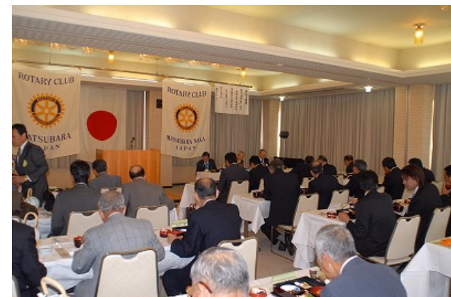
ガバナー公式訪問 松原RC・松原中RC合同例会

3) 本日、14時から定例理事会を開催いたします。理事、役員の方はご出席よろしくお願ひ致します。