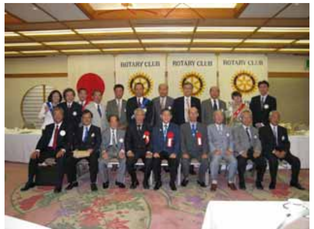
堺清陵ロータリークラブ