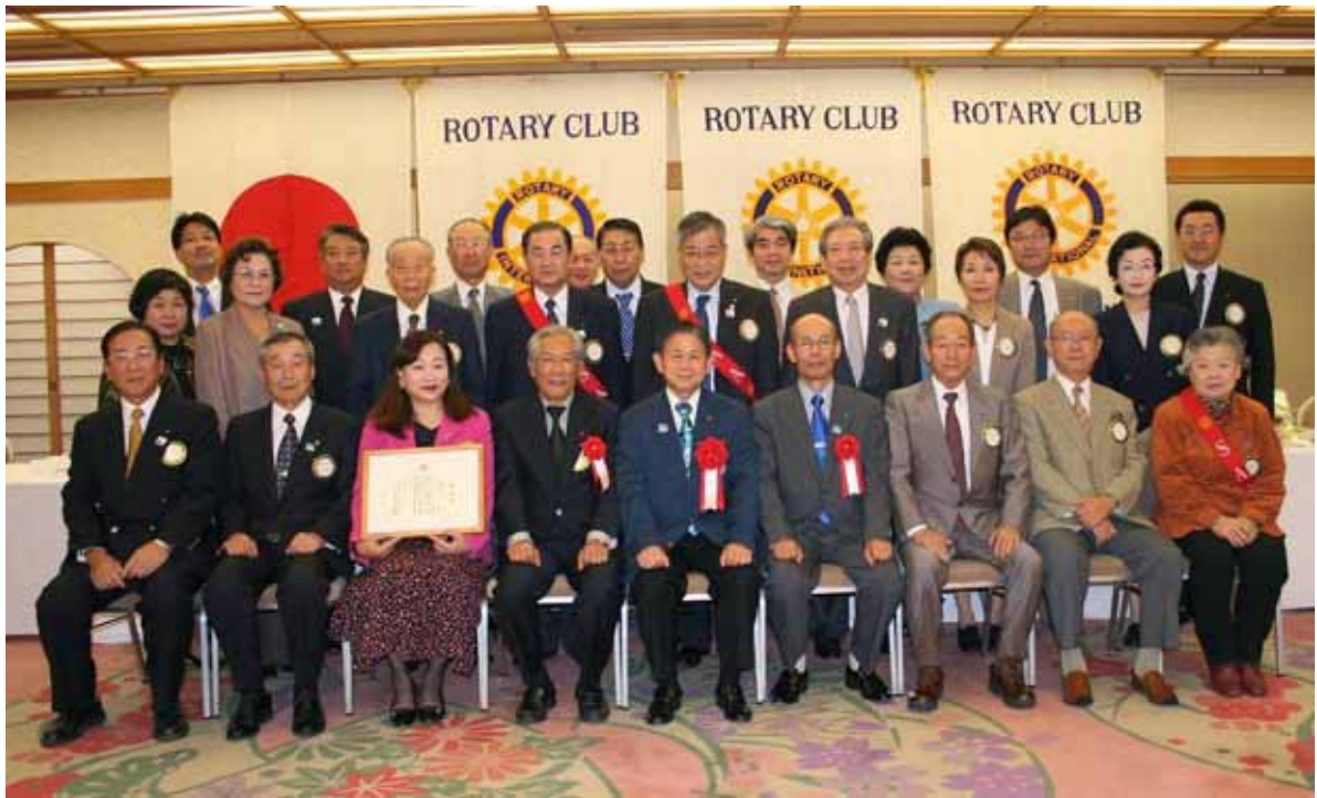
堺フェニックスロータリークラブ