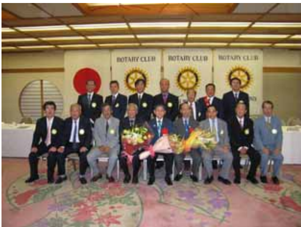
堺北西ロータリークラブ