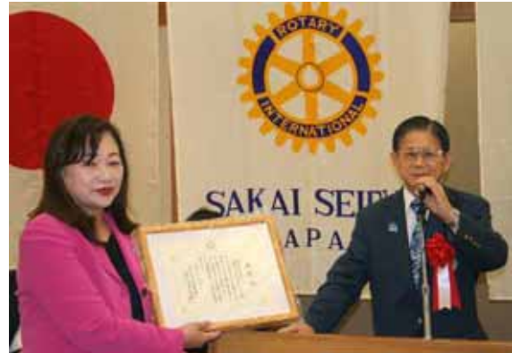
米山奨学会 1000 万円達成クラブ感謝状